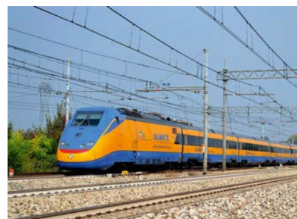
2 I treni e sistemi diagnostici costruiti dalla Mermec sono utilizzati sulle linee ferroviarie di sessanta paesi, Italia compresa.