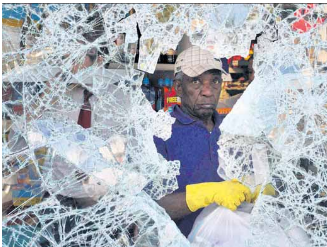
„Die Ausgrenzung einzelner Schichten ist auch bei uns ein Thema“, schreibt ein Leser.

Die Randalierer in Großbritannien haben die Hoffnung auf Veränderung aufgegeben – Reaktionen zu den Unruhen